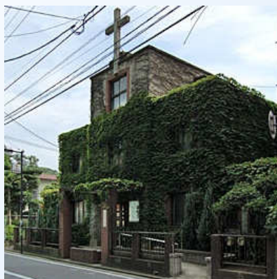
日本基督教団の福岡警固教会。建築家中村鎮の設計で1929年竣工。