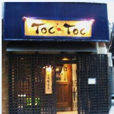
T O C - T O C の店構え