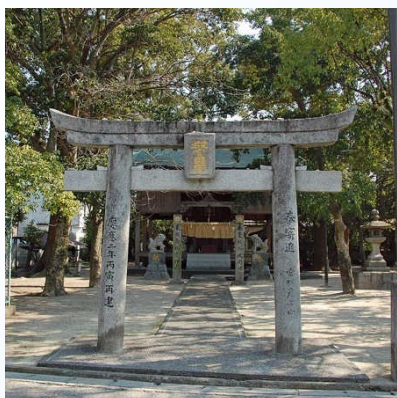
江戸時代に天神に移転された警固神社。社務所は貸しホールになった。

さて、街あるき食べあるきは今月も自粛などせずに粛々と書き綴ります。今月は、地味ながらも着実に魅力を増し続けるアダルトなエリア、警固界限です。警固という地名は読んで字のごとく警備を固めるという意味で、古代大宰府政庁時代、外交を担った「鴻臚館」とともに国防を担った役所だった「警固所」の名残です。現在、天神の三越デパートの脇にある警固神社は、黒田長政が築城の折に今の場所に移したもので、以前は警固地区にあったということです。